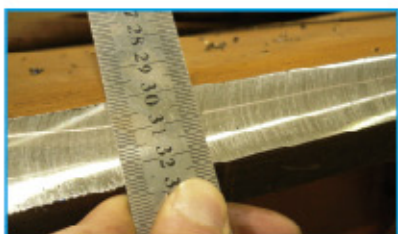
高强钢加工面质量